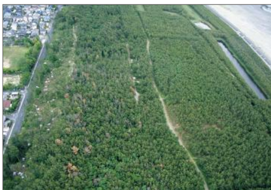
防風林松くい虫被害調査撮影