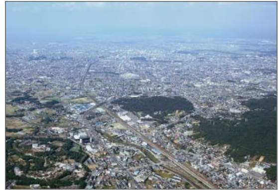
広範囲における景観撮影