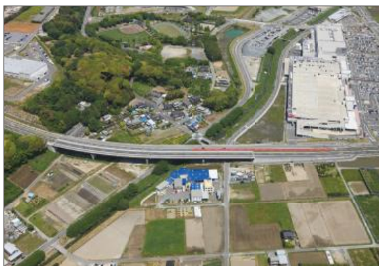
工事完成時の景観撮影