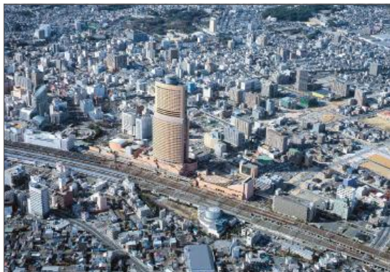
市街地形形成状況の景観撮影